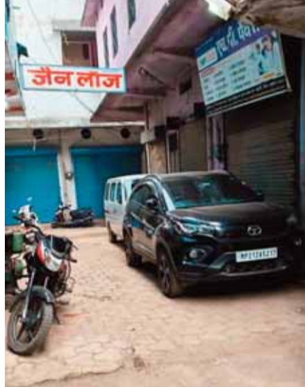
नगर परिषद प्रशासन से अपेक्षा कि नगर वार्ड में संकरी गलियों में लोगों के द्वारा जो पार्किंग बना रखा उनसे अतिक्रमण मुक्त करें प्रशासन स्थानीय से अपेक्षा है कि रीवा शहडोल राजमार्ग पर अतिक्रमण हटाए जाने चाहिए जिससे गम्भीर घटना घटने होने से पहले प्रशासन को अतिक्रमण करें।

ब्योहारी। ब्योहारी नगर परिषद क्षेत्र के अन्तर्गत बीच सड़क में पार्किंग बना कर परिवहन नियम को तिलांजलि देते हुए डन्के कि चोट में व्यापारी* ब्योहारी नगर परिषद क्षेत्र में आज ये स्थिति है बस्ती में अपने अपने प्रतिष्ठान के सामने बीच सड़क में पार्किंग बना कर परिवहन नियम एवं नगर परिषद क्षेत्र के वादों कि संकरी गली में अतिक्रमण कर सड़क पर पैदल राहगीर व छोटे वाहन को निकलने बड़ा मुश्किल होता है ये हाल वार्ड में यहां पर प्रशासन नाम कोई व्यवस्था नहीं है। *इसी तरह ब्योहारी का हृदय दिल कहां जाने वाला बनसुकली चौराहा रीवा शहडोल मार्ग पर राष्ट्रीय राजमार्ग पर अतिक्रमण कर सड़क किनारे दोनों साइड दुकान सजा कर अच्छा लोगों के द्वारा व्यापार किया जाता है इसी तरह शहडोल मार्ग साइड बस स्टैंड, पुरानी मजिस्ट्रेटी, जय स्तंभ, जंगल चौकी, ब्योहारी थाना के आसपास, रेलवे तिराहा, इसी तरह रीवा मार्ग पर राष्ट्रीय राजमार्ग के अन्तर्गत सड़क किनारे चूंगी नाका स्थित चारों तरफ सड़क किनारे बड़े बड़े व्यापार होता है टंकी तिराहा ब्योहारी में सड़क किनारे मेला जैसा लगा रहता है बड़े बड़े वाहन चालक वाहन चलाते हैं असुविधा होती है रीवा शहडोल राजमार्ग में कम हजारों वाहन का आना जाना रहता है और आपे दिन कोई कोई घटना देखने व सुनने को मिलती है*