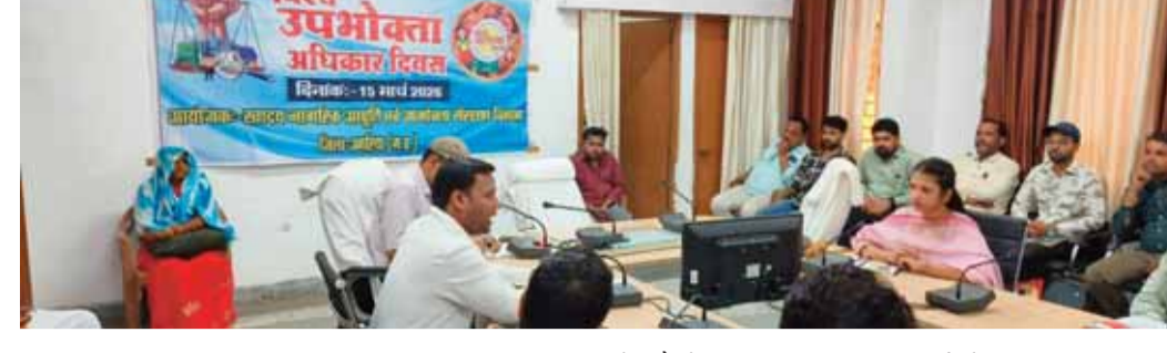
उमरिया उपभोक्ता अधिनियम उपभोक्ताओं के संरक्षण संबंधी कानून तो

जिले के कलेक्टर सभाकार में आज 15 मार्च विश्व उपभोक्ता दिवस के रूप में मनाया गया जिसका उद्देश्य उपभोक्ताओं को उनके अधिकार के बारे में जागरूक करना एवं उपभोक्ता संबंधी कानून का उपयोग कैसे करें बताना होता है, आज की स्थिति में हर 10 में से एक उपभोक्ता पीड़ित है, जो कहीं ना कहीं किसी न किसी माध्यम से ठगी का शिकार हो रहा है,