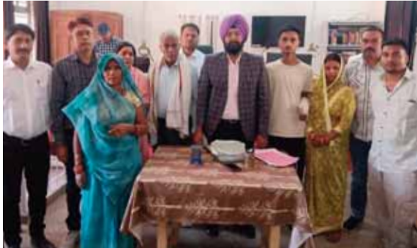
हरिभूमि न्यूजकोतमा। 14 मार्च सात वर्षों से चले आ रहे एक लंबे कानूनी विवाद का पटाक्षेप आज लोक अदालत में हो गया। कोतमा तहसील के जमुना